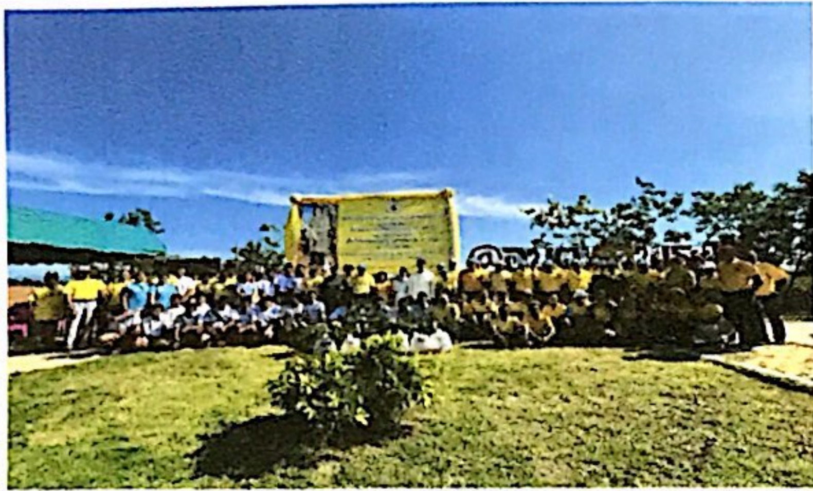
องค์การบริหารส่วนตำบลตาพระยา จัดกิจกรรมเนื่องในโอกาส วันเฉลิมพระชนมพรรษา พระบาทสมเด็จพระปรเมนทรรามาธิบดีศรีสินท รมหาวชิราลงกรณ พระวชิรเกล้าเจ้าอยู่หัว รัชกาลที่ 10 ณ สวนเฉลิมพระเกียรติตำบลตาพระยา หมู่ที่ 8 ตำบลตาพระยา อำเภอตาพระยา จังหวัดสระแก้ว