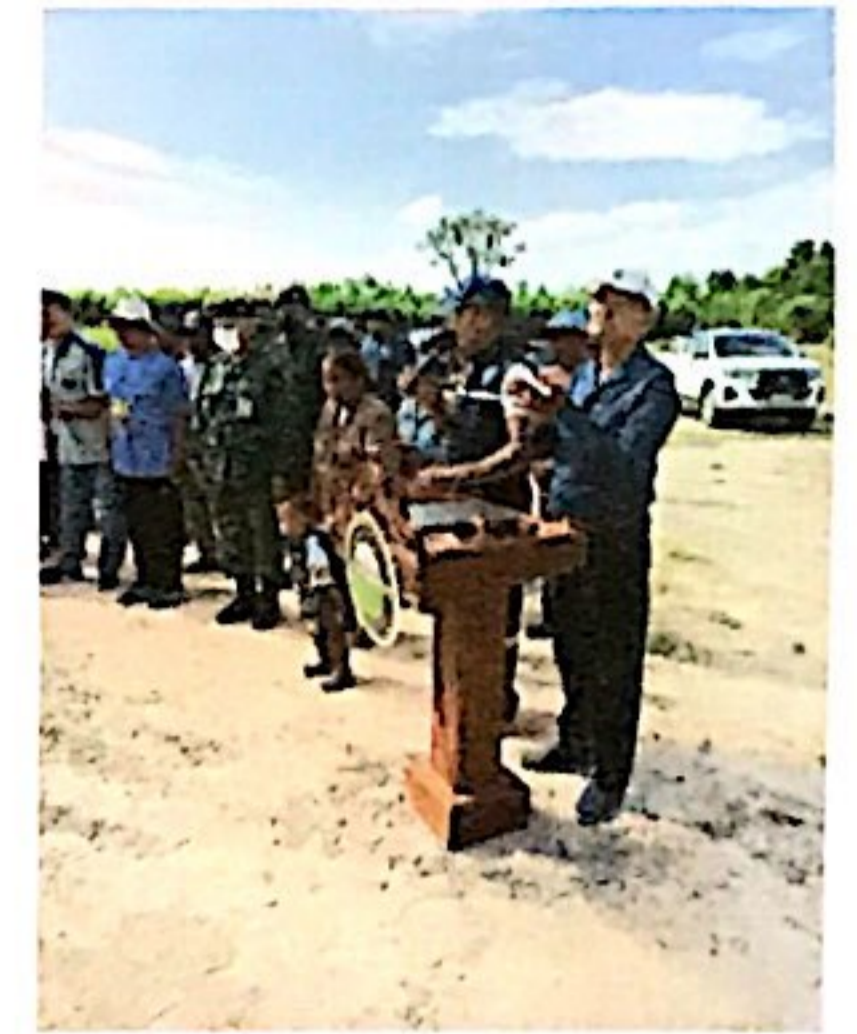
กองสาธารณสุขและสิ่งแวดล้อม องค์การบริหารส่วนตำบลตาพระยา จัดโครงการกำจัด ผักตบชวา ประจำปีงบประมาณ พ.ศ.2566 ณ หมู่บ้านเขาลูกช้าง หมู่ที่ 14 ตำบลตาพระยา อำเภอตาพระยา จังหวัดสระแก้ว