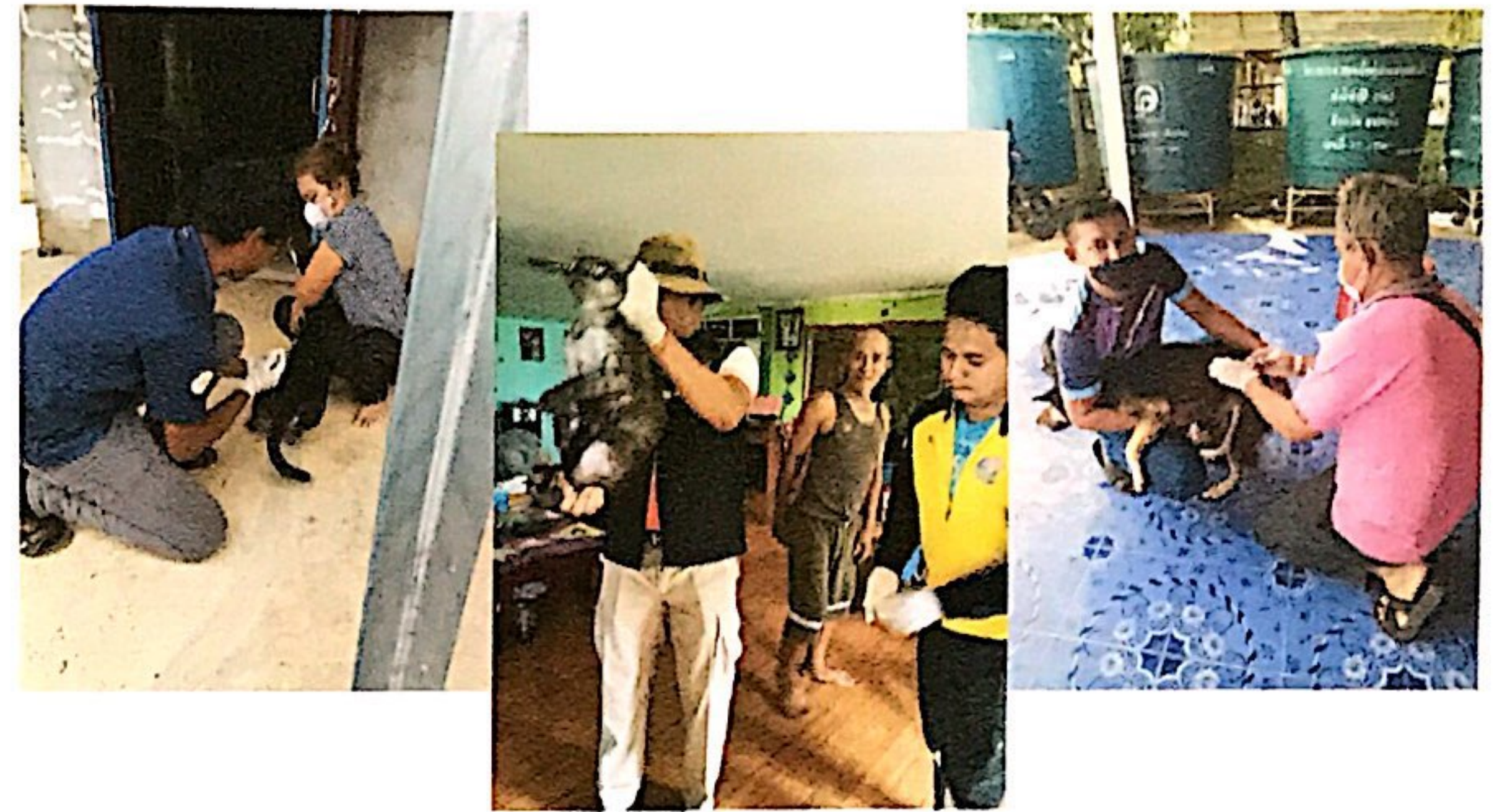
กองสาธารณสุขและสิ่งแวดล้อม องค์การบริหารส่วนตำบลตาพระยา ดำเนินการฉีดวัคซีนป้องกันโรคพิษสุนัขบ้าให้แก่สุนัขและแมว ในเขตพื้นที่ตำบลตาพระยา ภายใต้โครงการสัตว์ปลอดโรคคนปลอดภัยจากโรคพิษสุนัขบ้า ตามพระราชกฤษฎีกา ศาสตราจารย์ ดร.สมเด็จเจ้าฟ้าฯ กรมพระศรีสวางควัฒน วรขัตติยราชนารี ประจำปีงบประมาณ พ.ศ.2566