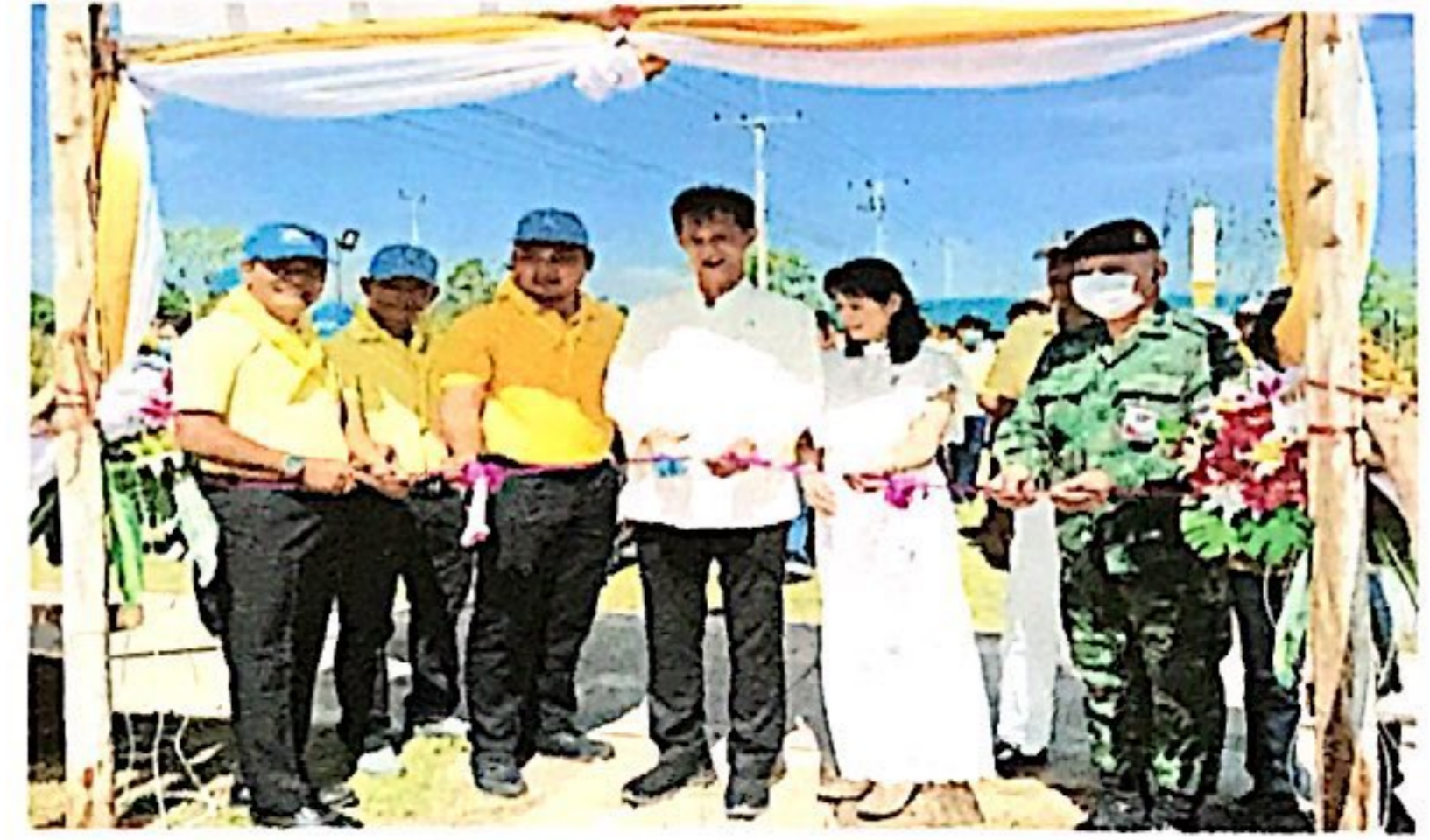
องค์การบริหารส่วนตำบลตาพระยา ดำเนินโครงการ 1 อปท. 1 สวนสมุนไพร เฉลิมพระเกียรติพระบาทสมเด็จพระเจ้าอยู่หัว เนื่องในโอกาสวันเฉลิมพระชนมพรรษา พระบาทสมเด็จพระวชิรเกล้าเจ้าอยู่หัว 28 กรกฎาคม 2566 ณ สวนเฉลิมพระเกียรติตำบลตาพระยา หมู่ที่ 8 ตำบลตาพระยา อำเภอตาพระยา จังหวัดสระแก้ว