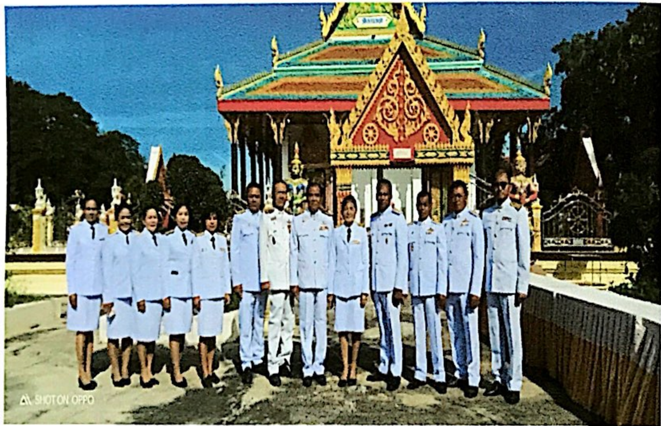
คณะผู้บริหาร สมาชิกสภา พนักงานส่วนตำบล พนักงานจ้าง องค์การบริหารส่วนตำบลตาพระยา เข้าร่วมพิธีตักบาตรถวายพระราชกุศล พิธีถวาย เครื่องราชสักการะ วางพานพุ่มและพิธีจุดเทียนถวายพระพรชัยมงคล เนื่องในโอกาสวัน เจริญพระชนมพรรษาพระบาทสมเด็จพระวชิรเกล้าเจ้าอยู่หัว 28 กรกฎาคม 2566 ณ หอประชุมอำเภอตาพระยา