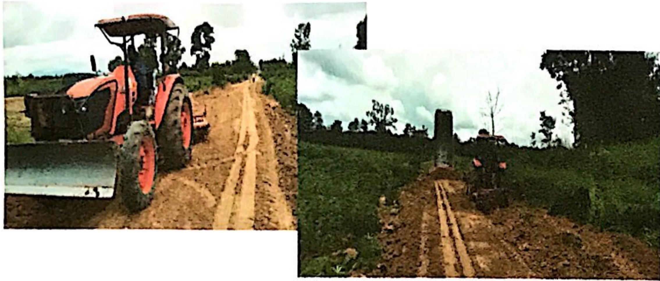
กองช่าง องค์การบริหารส่วนตำบลตาพระยา ดำเนินโครงการปรับปรุงถนน เพื่อการเกษตร ในพื้นที่ตำบลตาพระยา