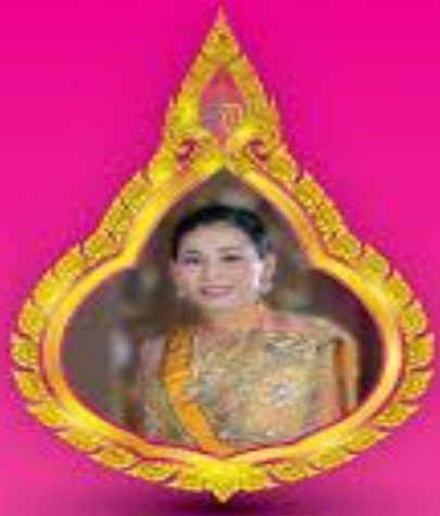
ทรงพระเจริญ