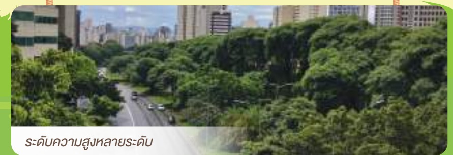
ระดับความสูงหลายระดับ

ควรใช้ต้นไม้ที่สูงหลายระดับ เพราะฝุ่นลอยอยู่ใกล้พื้นดินไปจนถึงหลายสิบเมตร อาจทำเป็นไม้เลื้อยตามถนน ทำเป็นต้นไม้เกาะตามเสาของสะพาน เป็นต้น