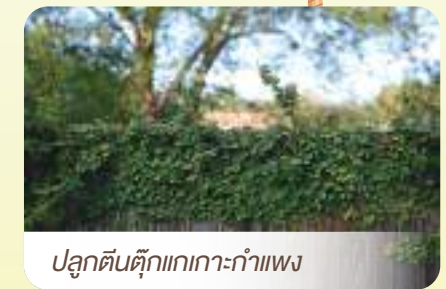
ปลูกต้นตุ๊กตาเกาะกำแพง