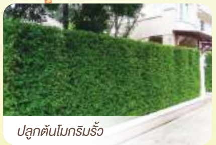
ปลูกต้นไม้กริมรั้ว

เริ่มตั้งแต่ปลูกเป็นรั้วต้นไม้ ไม้พุ่ม ไม้กระถาง ปลูกตามระเบียงบ้าน เกาะผนัง เกาะกำแพง และชั้นหลังคา