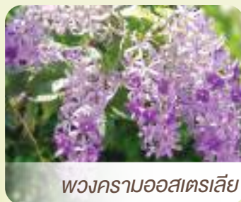
พวงครามออสเตรเลีย

ลำต้น ก้านที่โครงสร้างพันกันซับซ้อน เช่น ไม้เลื้อยต่าง ๆ